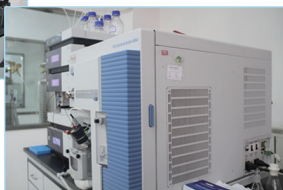
高效液相色谱串联质谱仪