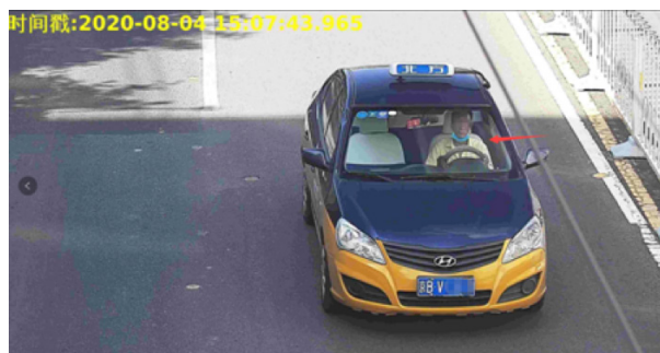
（违法图片示例1：驾车不系安全带）

交管部门提醒广大驾驶员，目前全市“电子警察”已经实现对不系安全带、接打查看手机、闯红灯、超速、违停、违反禁限行、占用专用车道、外埠车未办进京证、违法鸣笛等20多种违法行为进行抓拍。在依托科技手段严格管理的同时，交管部门也将持续加大路面执法力度，助推驾驶员养成安全习惯，拒绝驾驶陋习，守法行车，共同营造安全有序的出行环境。（市交管局网）