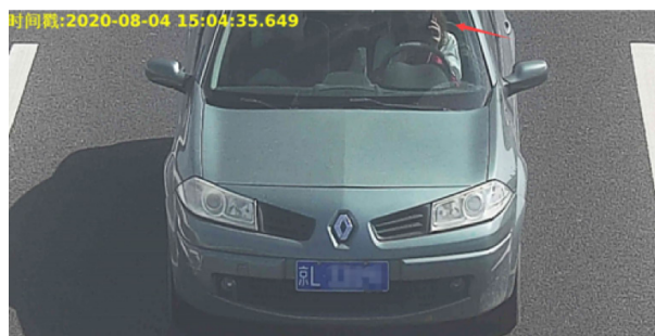
（违法图片示例2：驾车接打查看手机）