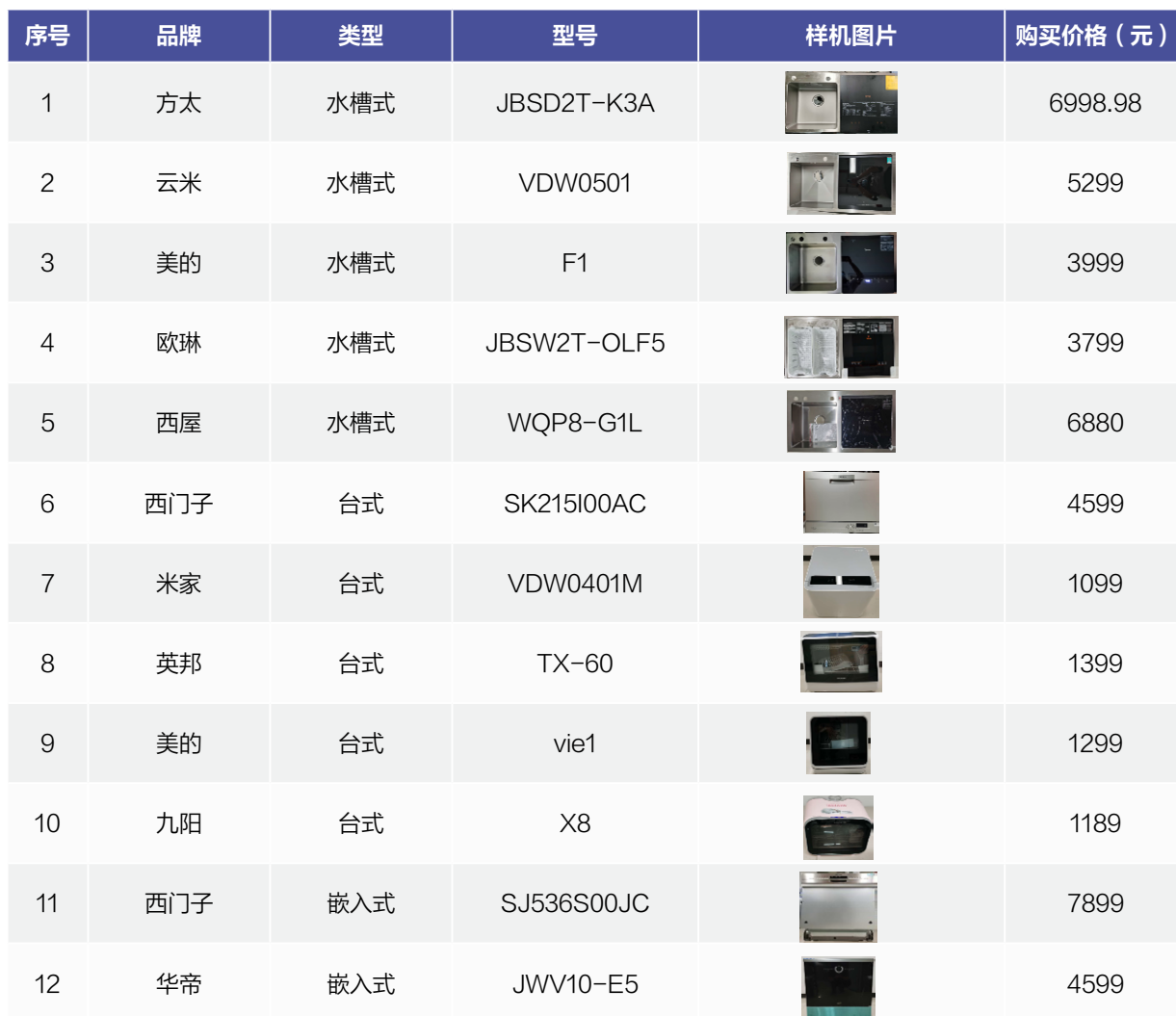
表1：本次比较试验样品基本情况

本次比较试验样品由北京市消费者协会工作人员以普通消费者的身份从电商平台购买，涉及11个品牌的15个样品。购买价格从1189元/台到7899元/台不等。具体见下表。