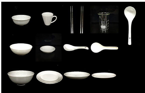
图1 本次比较试验所用标准中式餐具样式

其中，除菌性能测试项目是针对明示具有除菌功能的洗碗机产品，按照相关标准要求，使用欧式餐具进行测试；重油污洗净性能测试项目是针对明示具有清洗重油污功能的洗碗机产品，使用中式标准餐具进行测试；其他测试项目则按照标准的相关要求进行测试。本次比较试验结果仅对购买的样品负责。