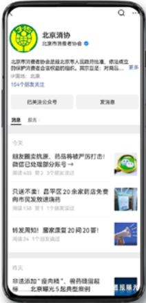
●“北京消协”微信公众号